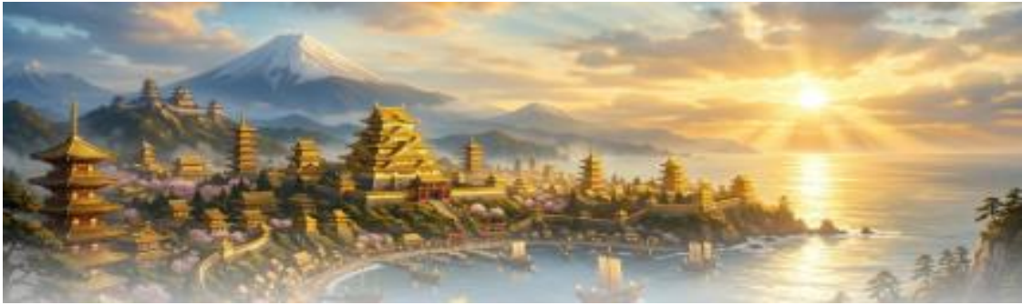
(↑ : AI が作成した、黄金の国ジパング)

日米欧が協力して、南極や北極、グリーンランド付近等の公海に、CO2 を吸収してくれる木造人工島のブルーカーボンを設置し、海藻の育成管理や栄養分の補給、SeaSola 等のメンテナンス要員を派遣し、世界のカーボンニュートラルの早期達成のためにと、国際探掘権を獲得した上で「海底資源探掘箱」を海底に投下し金銀銅やレアアース等の探掘を同時に行うと効率よくできます。